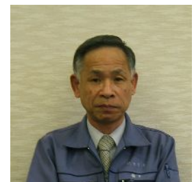
EPSのことなら任せて安心 宮下部長