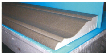
【樹脂モルタルタイプ】