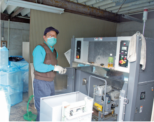
▲ リサイクルの様子