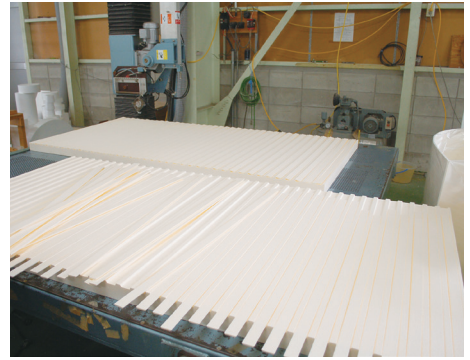
▲ ブロックのカット加工の様子