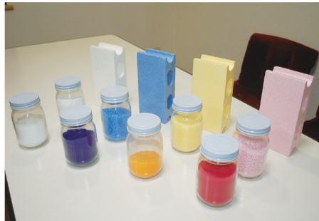
▲ 原料ビーズと製品

独自の輸送体制の構築や、発泡スチロールに関するすべてを担う「貫生産体制」など、常に「顧客第一・納期第一・ユーザー密着」を念頭に置く姿勢が、顧客のパートナー企業としての存在価値を高めているのだと感じることができました。