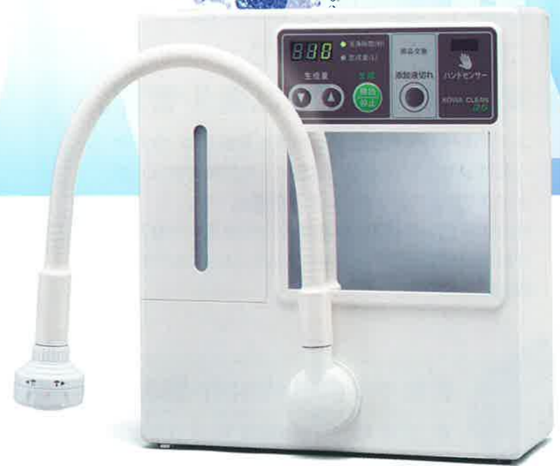
微酸性次亜塩素酸水生成装置 KOWA CLEAN 25 コア・クリーン 25

除菌・殺菌の水。 微酸性次亜塩素酸水の強力パワー。 コア・クリーンは、厚生労働省から食品添加物殺菌料として認められた成分規格の微酸性次亜塩素酸水の生成装置です。