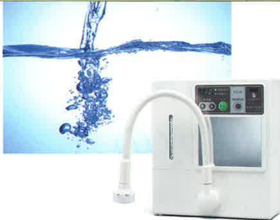
微酸性次亜塩素酸水生成装置 KOWA CLEAN 25 コア・クリーン 25