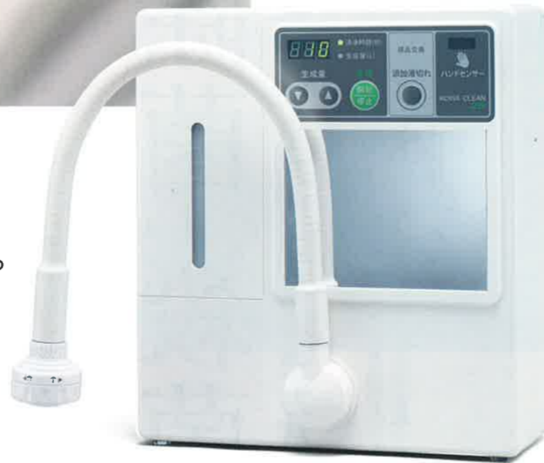
微酸性次亜塩素酸水生成装置 KOWA CLEAN 25 コア・クリーン 25