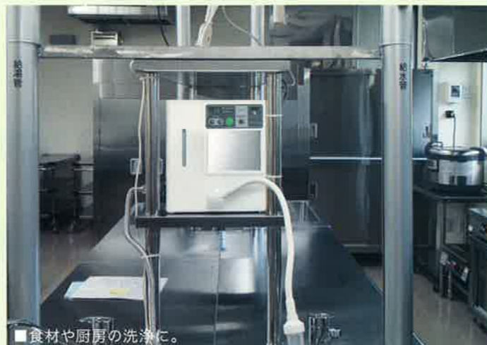
■食材や厨房の洗浄に。